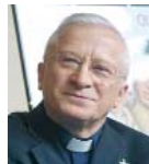
Cardinale Ennio Antonelli

sensibilizzare le famiglie del territorio per la partecipazione alle cinque giornate celebrative e per l'accoglienza delle famiglie ospiti e un fruttuoso incontro con loro». E a livello delle comunità cristiane quale percorso sarebbe utile in preparazione all'Incontro? «Il Papa stesso nella sua Lettera ha invitato a fare un cammino ecclesiale di avvicinamento all'Incontro mondiale con iniziative a livello parrocchiale, diocesano e nazionale, valorizzando anche il XXX anniversario dell'Esortazione